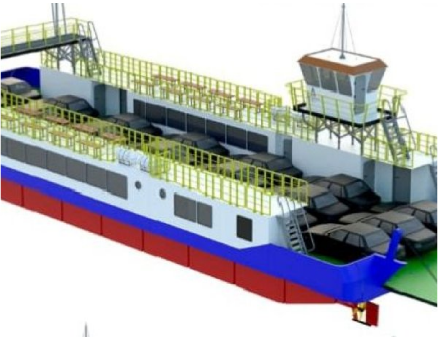
Tesk Foto : Desain Gambar Kapal Motor Penyeberangan (KMP) Sumut III

SIMALUNGUN -Guna memperlancar konektivitas wisatawan dan masyarakat menuju Pulau Samosir, Negeri Indah Kepingan Surga dari Kabupaten Simalungun, PT Pembangunan Prasarana Sumatera Utara (PPSU) akan segera